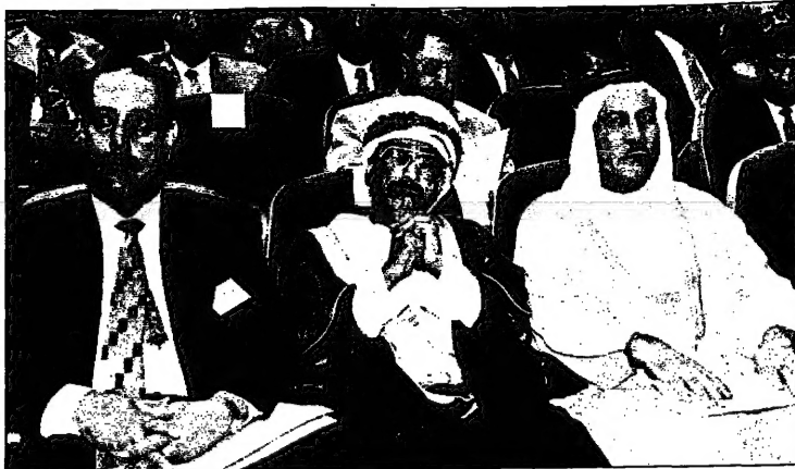
جانب من حضور في الجلسة الافتتاحية للمؤتمر العربي السادس للطاقات

افتتاح المؤتمر العربي السادس للطاقات في دمشق